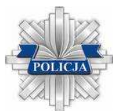
Posterunek Policji w Kuźni Raciborskiej

Opracowano na podstawie różnych materiałów źródłowych przy współpracy Posterunku Policji w Kuźni Raciborskiej i Urzędu Gminy Nędza